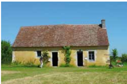
• Amélioration de logements locatifs à loyer maîtrisé