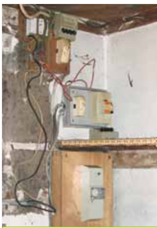
• Mise aux normes