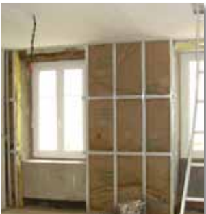
• Économies d'énergie