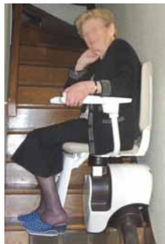
• Maintien à domicile